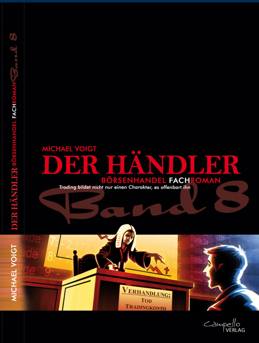
BUCHCOVER: BUCHREIHE DER HÄNDLER BAND 8 VON MICHAEL VOIGT.

Sie stehen vor denselben Herausforderungen und können das Gefühl nachvollziehen, wenn du mal wieder mit deinem Regelwerk oder deinem Risiko- oder Geldmanagement haderst. Diese gemeinsamen Erlebnisse und Erfahrungen zu teilen, macht diese Seminar umso angenehmer.