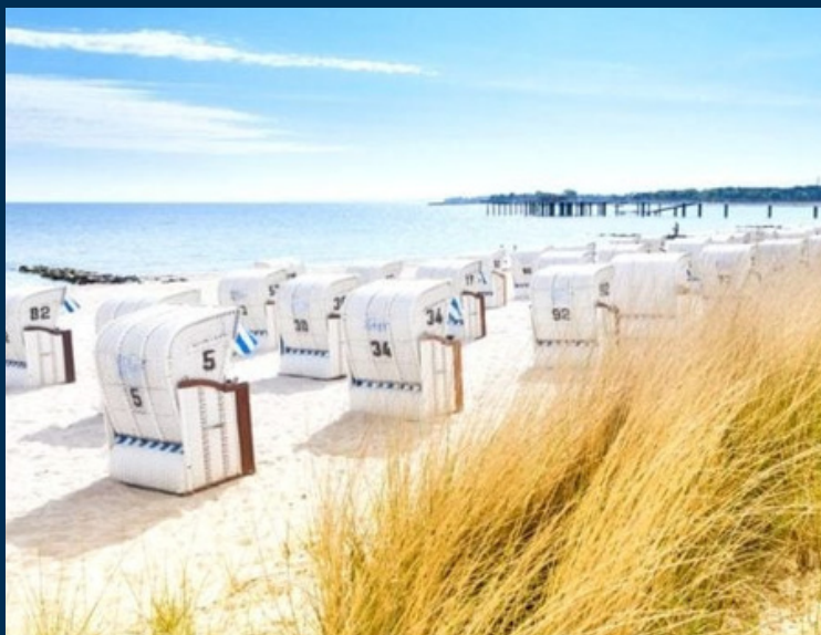
Das Seminar findet auf der Insel Usedom statt; fernab von Großstadt und Lärm.